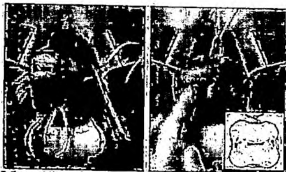
Рис.1. Метод Макдональда